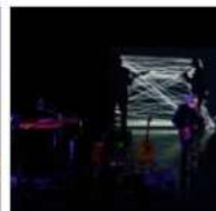
Oper_in_a Bottle_Massimo Buffetti