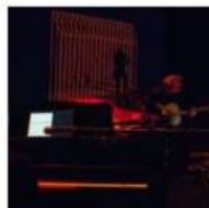
Oper_in_a Bottle_Massimo Buffetti_03